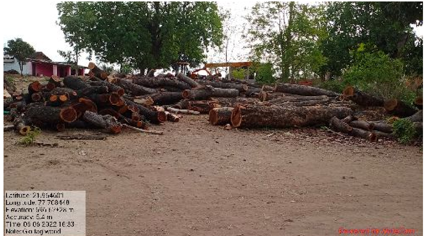
Photo of the Forest Produced - 1

Latitude: 21.9546011 Longitude: 77.708440 Elevation: 536.07428 m Accuracy: 5.4 m Time: 09/05/2022 16:53 Notes: Gola logwood